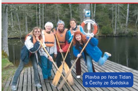
Plavba po řece Tidan s Čechy ze Švédska