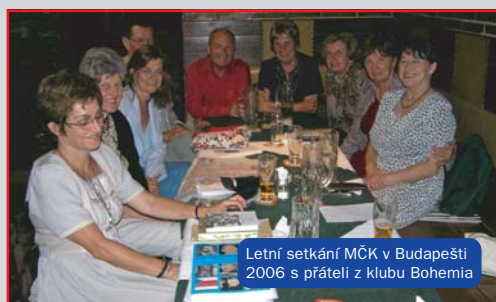
Letní setkání MČK v Budapešti 2006 s přáteli z klubu Bohemia